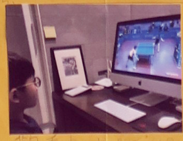
觀看桌球選手的影片。