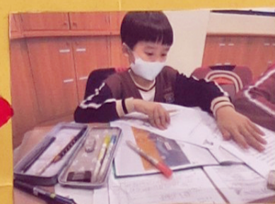
查資料或是跟教練打，從打球的過程中找到錯誤修改過來。